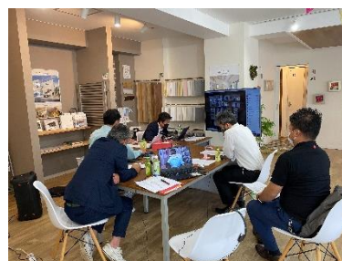
※通常総会(組合事務所)