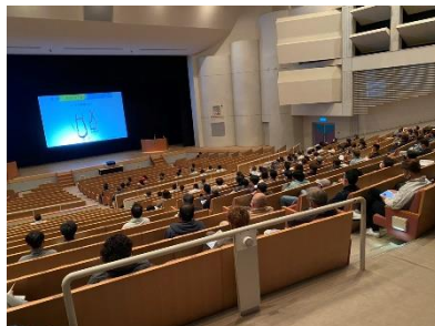
※フルハーネス講習会(那珂川)