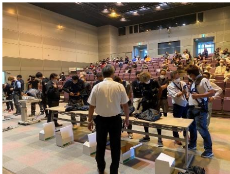
※フルハーネス講習会(鳥栖)