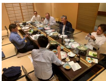
※意見交換会(鹿児島)