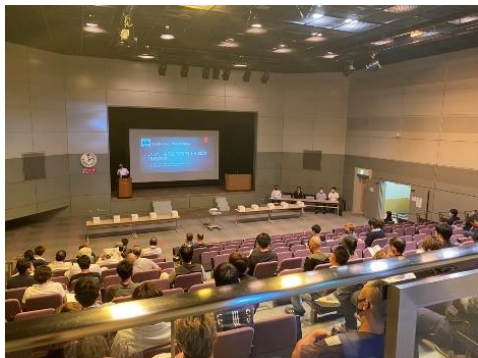
※フルハーネス講習会(鳥栖)