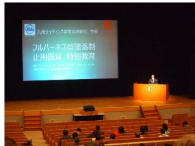
※フルハーネス講習会(那珂川)