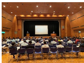
※フルハーネス講習会(諫早)